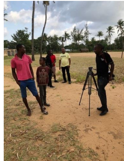
video-opnamen voor de documentaire

https://drive.google.com/file/d/1aEtqDF9YahKIItQ1ph1I973Kxf6McFJ04/view?usp=drives:dk